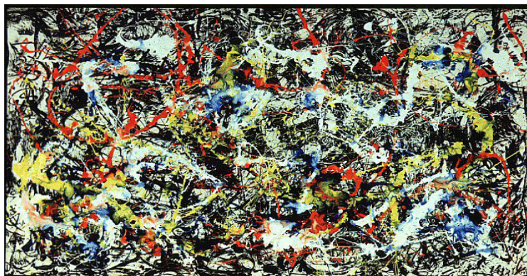
Figura 1. Jackson Pollock - “Convergence”, 1953

Fonte: Emmerling, L. (2003). Jackson Pollock: 1912 – 1956 (p. 39). Köln: Taschen. Recuperado em 14 junho, 2007, de http://www.globalgallery.com/enlarge/42776/