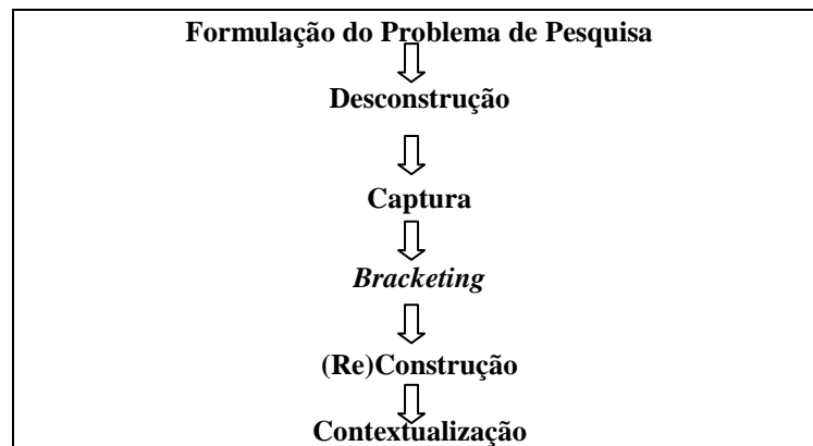
Figura 2. Etapas do Processo Interpretativo