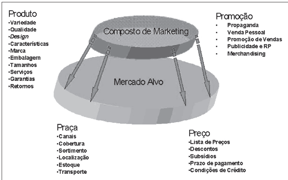
Figura 1: Os 4 P's do Composto de Marketing

Vários autores utilizam uma lista de variáveis (variáveis controláveis de marketing) ou ferramentas, e de atividades relacionadas a elas para facilitar a explicação do conceito de composto de marketing. Dessa forma, para McCarthy (1996), o composto de marketing compreende decisões que a empresa precisa tomar sobre as variáveis controláveis, com o intuito de atingir o mercado-alvo. Ainda segundo o mesmo autor, para organizar e simplificar as decisões, as variáveis controláveis de marketing podem ser divididas em quatro grupos conhecidos como os quatro P's do marketing: Produto, Preço, Promoção e Praça (Distribuição), conforme Figura 1.